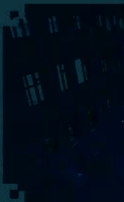
PLC 控制技术 训练场所